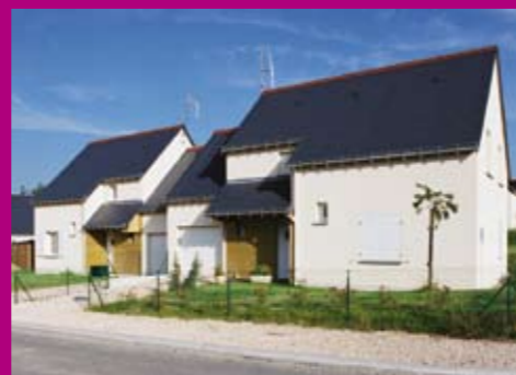
Crotelles : "La Malicornière"

La liste est arrêtée annuellement par le Conseil d'Administration. Ils doivent être construits depuis plus de 10 ans, être correctement entretenus et respecter les normes minimales d'habitabilité. Un logement occupé ne peut être vendu qu'à son locataire. A sa demande, il peut être vendu à ses descendants ou ascendants, sous réserve de respect des plafonds de ressources.