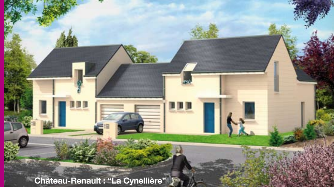
Château-Renault : "La Cynellière"

Val Touraine Habitat propose, en priorité, à ses locataires de devenir propriétaire de leur appartement dans les communes et groupes suivants :