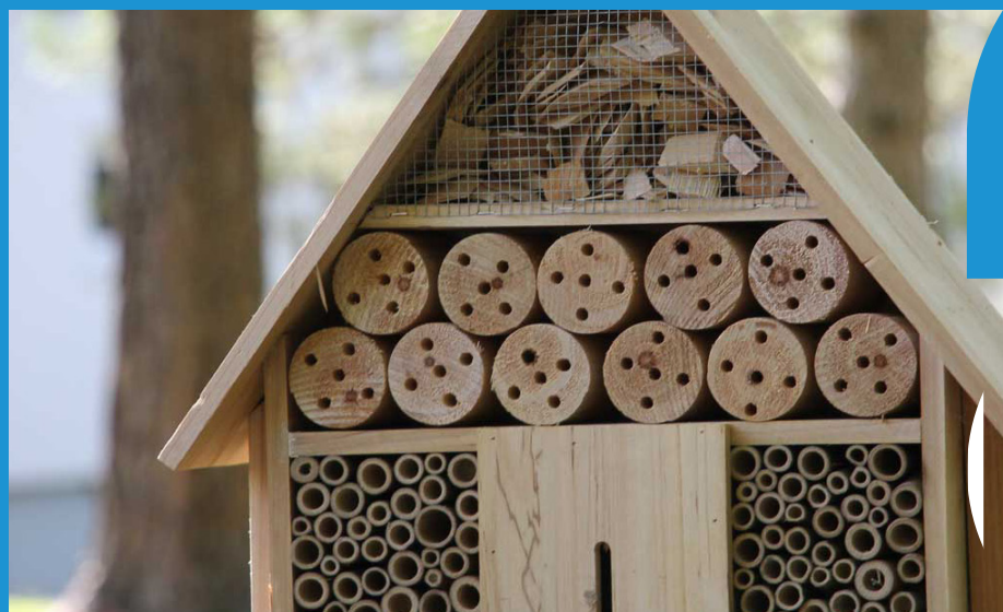
«Les 3 Guigniers» - Monts

Cet axe traduit une ambition forte : réduire notre impact environnemental en privilégiant l'économie circulaire, les produits responsables et la sobriété des consommations. En intégrant des exigences environnementales systématiques, en développant le réemploi et en limitant les déchets comme les déplacements, il renforce un modèle d'achat plus durable et exemplaire.