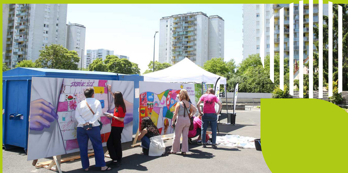
Festival «Mur sur Loire» – Saint-Pierre-des-Corps

Cet axe renforce une commande publique plus responsable en garantissant l'égalité professionnelle, en favorisant l'insertion et en soutenant l'économie sociale et solidaire. Il vise aussi à mieux prendre en compte les locataires en site occupé et à intégrer les enjeux environnementaux dans nos consultations.