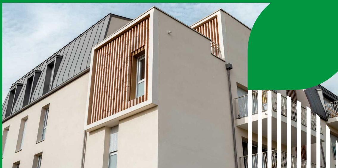
«Quai de Loire» - Montlouis-sur-Loire

Cet axe met en avant des leviers visant à simplifier l'accès des PME à la commande publique et à rendre nos besoins plus lisibles.