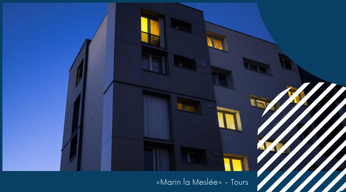
«Marin la Meslée» - Tours

Cet axe vise à renforcer la transparence, à développer les compétences internes en achat durable et à assurer le suivi du schéma.